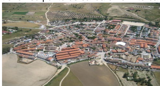
Fotografía aérea de Villamanta

El servicio depende de Autobuses EL GATO. Los horarios y las líneas está publicados en su web www.elgatobus.com o en la página web del Consorcio de Transportes de Madrid www.ctm-madrid.es . Las líneas tienen su punto de salida en el intercambiador de Príncipe Pío.