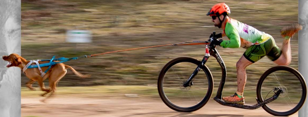
Fotografía: Congela el viento* de Juan Pablo Pascual Santos (ganadora Concurso de Fotografía Mushing Tierra de Dinosaurios 2024)