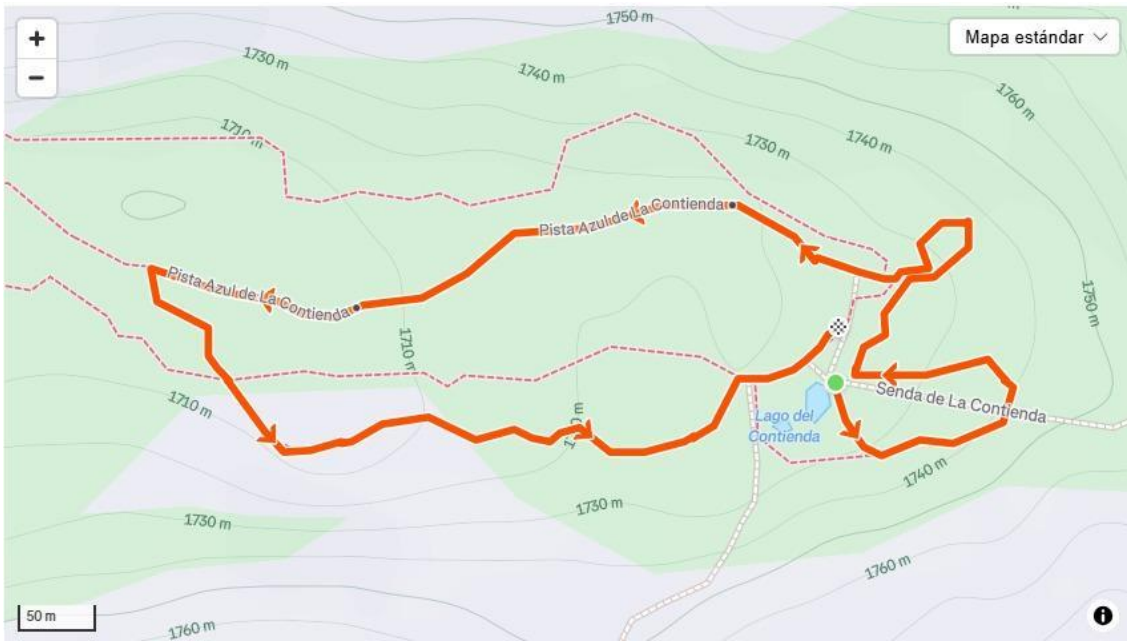
Circuito C 1,2km